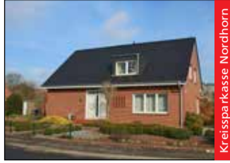
Kreispa Kasse Nordhorn