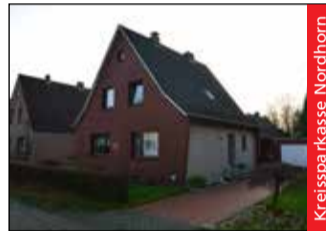
Kreispa Kasse Nordhorn