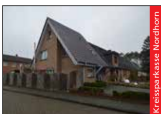
Kreispa Kasse Nordhorn