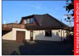
Kreispa Kasse Nordhorn