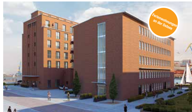
Ferienwohnungen an der Ostsee