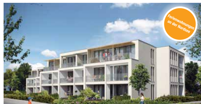
Ferienwohnungen an der Nordsee