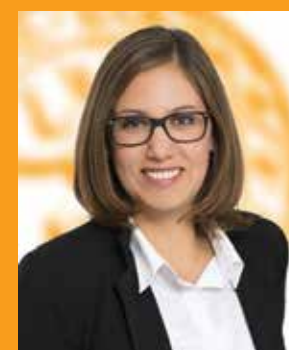
Marny Steveker Immobilien