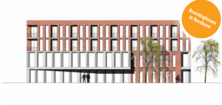
Boardinghouse in Nordhorn