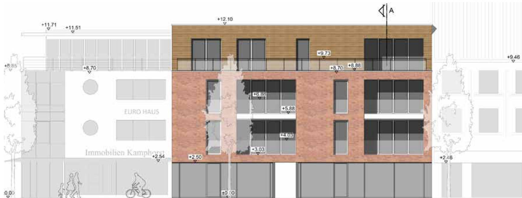
Ansicht: Bentheimer Straße 13

Ab sofort können die entstehenden Wohnungen und Ladenlokale angemietet werden. Nach telefonischer Absprache können Beratungsgespräche über die Anmietung vereinbart werden. Gerne stellen wir Ihnen das Projekt und die Wohnungen umfassend dar und beantworten Ihre Fragen. Überzeugen Sie sich selbst von dem guten Preis-/Leistungsverhältnis. Wir freuen uns auf Ihren Besuch!