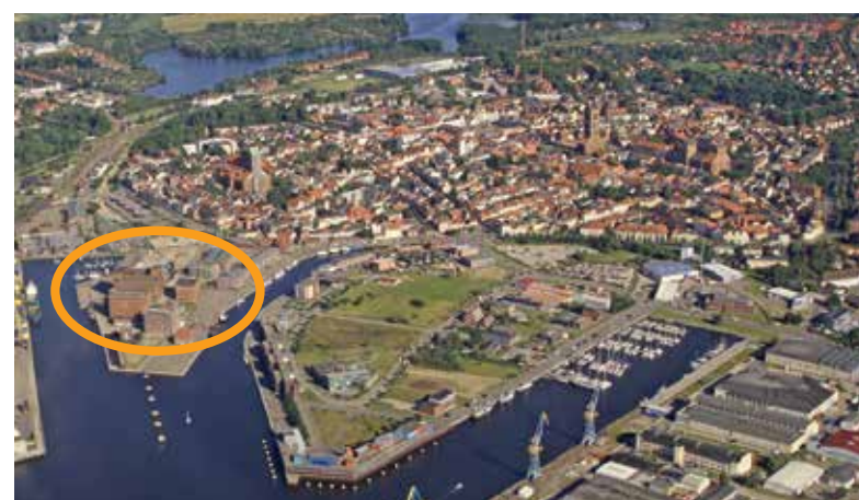
Abb.4 - Luftaufnahme Wismar - Alter Hafen