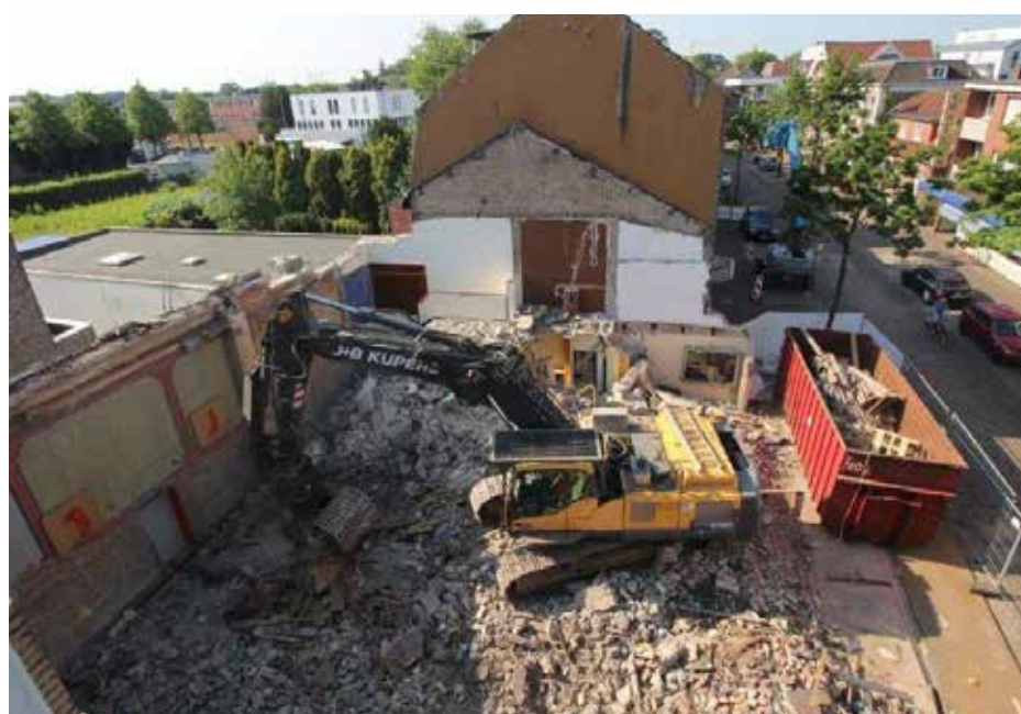
Das alte Bavaria-Kino ist bereits vollständig abgerissen