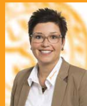
Kirsten Ottenhues Versicherungen