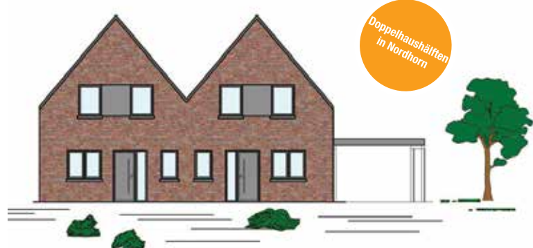
Doppelhaushälften in Nordhorn

Auch für 2019 gibt es bereits interessante Vorhaben – sowohl in der hiesigen Region und im Oldenburger Land als auch an Nord- und Ostsee. Mehr zu aktuellen und kommenden Projekten erfahren Sie von den Mitarbeitern der Finanz-Union während des Immobilienfrühlings.