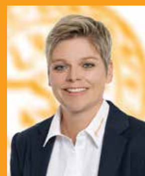
Silke Berger Finanzierungen